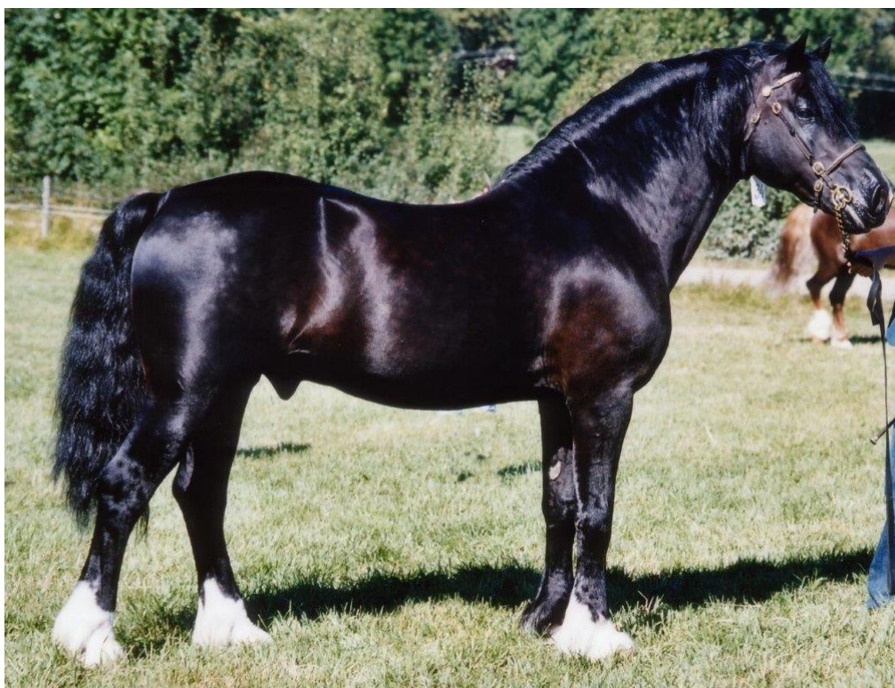
Burhults Black Commence (2003)

Burhults Toy och Trofe deltog 1999 på The Royal Welsh Show med var sin hedrande tredje placering. Burhults Tip Top med Josefin Tollbom i sadeln fick en fin tredje placering i Lead Rein på Centenary Show i Builth Wells 2002.