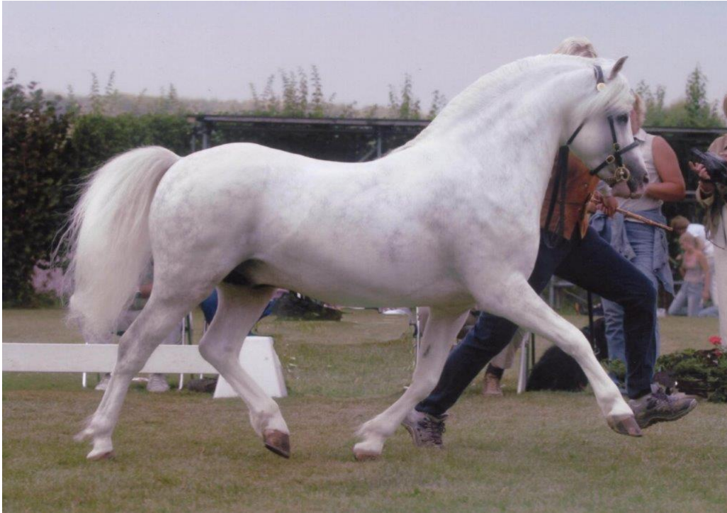
Burhults Trofe (Aachen 2003)