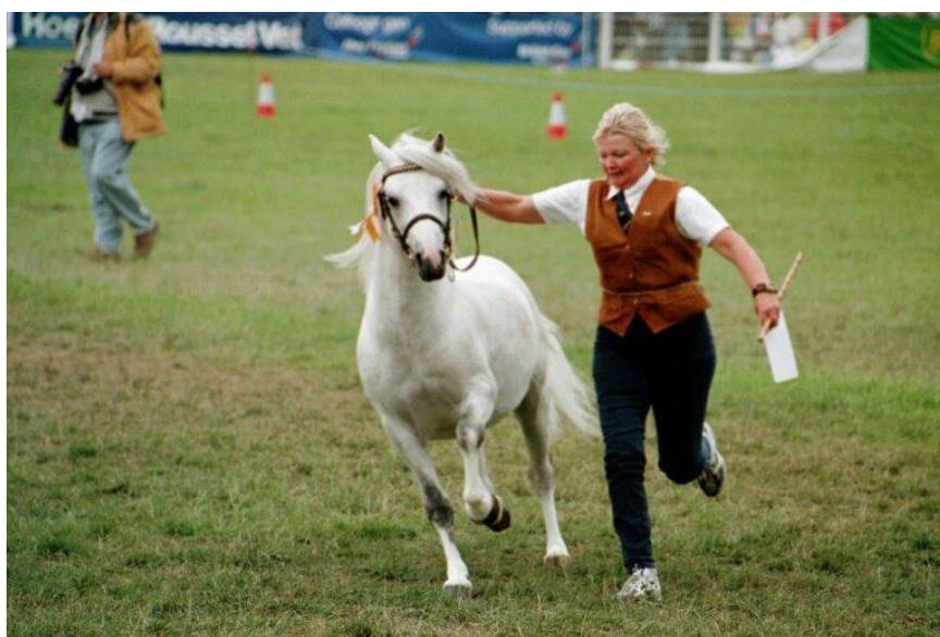
Burhults Toy och Gunn (Royal Welsh Show 1999)