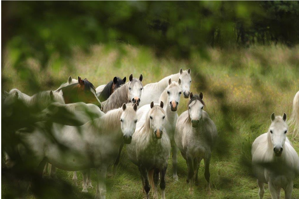
Welsh Mountain-flocken på Burhult

- ridskolan som använder Welshens olika sektioner